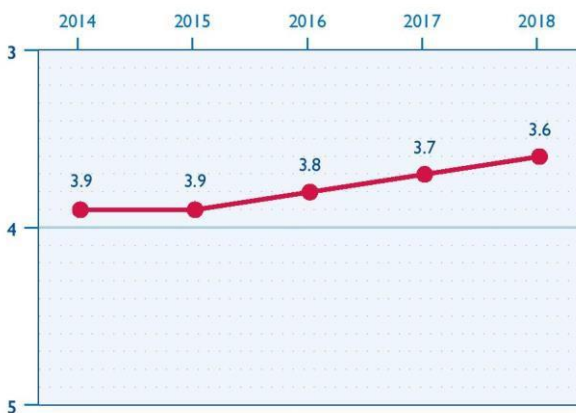
ԻՐԱՎԱԿԱՆ ՄԻՋԱՎԱՅՐԸ ՀԱՅԱՍՏԱՆՈՒՄ

2018 թվականին ՔՀԿ ոլորտը կարգավորող իրավական միջավայրը փոքր-ինչ բարելավվել է պետական կառույցների և պետության անունից հանդես եկող խմբերի կողմից ՔՀԿ-ների և նրանց անդամների նկատմամբ ճնշումների և ոտնձգությունների նվազման արդյունքում: